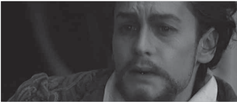
• Helmut Berger dans Ludwig ou le Crépuscule des dieux (1972) de Visconti •