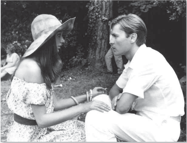
• Avec Marisa Berenson lors du tournage du Jardin des Finzi-Contini en 1970 •